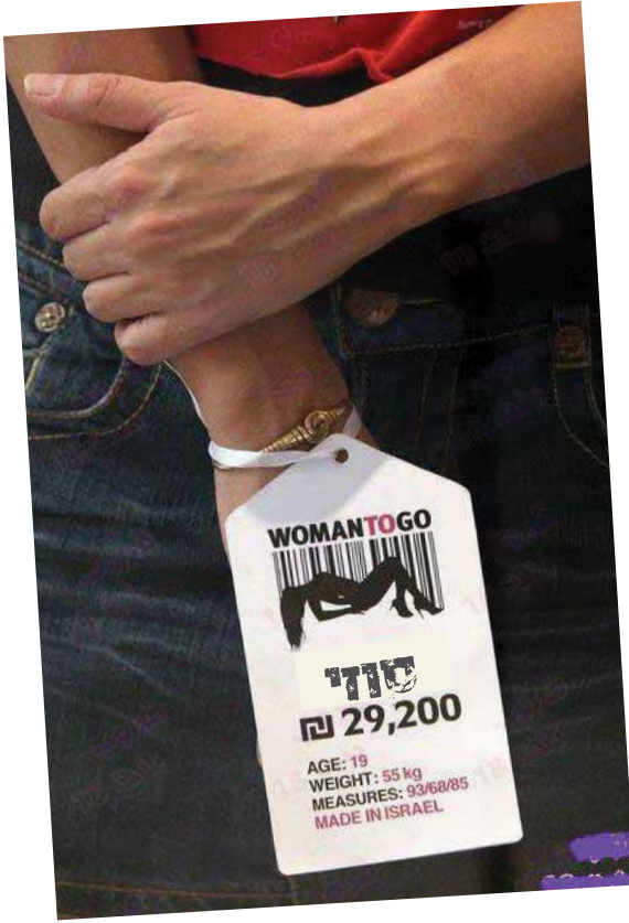
مجموعة صور: حملة التوعية ضدّ المتاجرة بالنساء